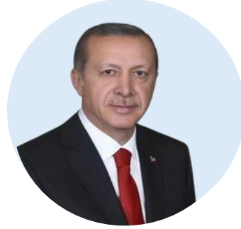
Recep Tayyip ERDOĞAN